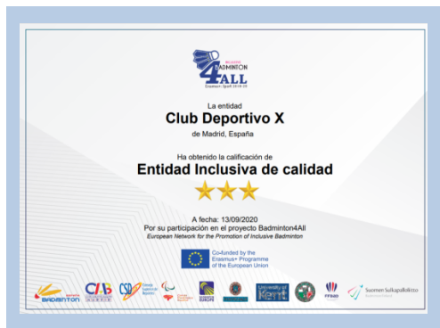
3 Estrellas- Calidad