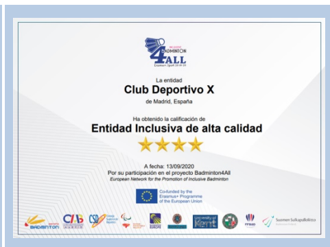
4 Estrellas – Alta calidad