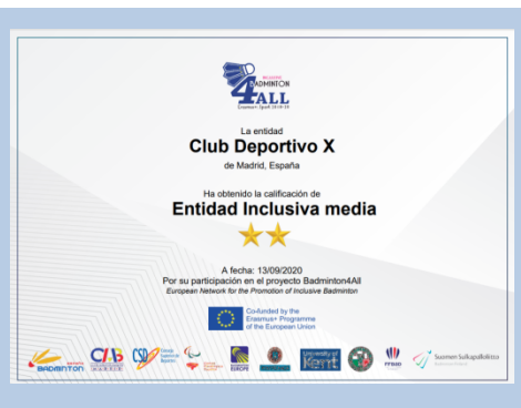
2 Estrellas – Media Calidad