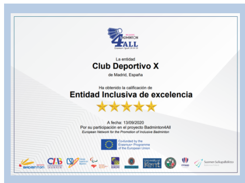
5 estrellas - Excelencia

Cada certificado recoge en su anverso los requisitos que se han cumplido para obtener el nivel o grado de calidad otorgado.