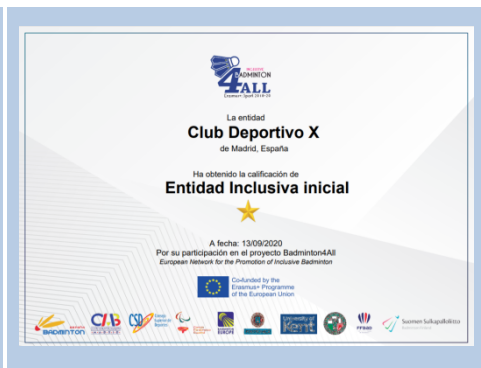
1 Estrella – Calidad inicial